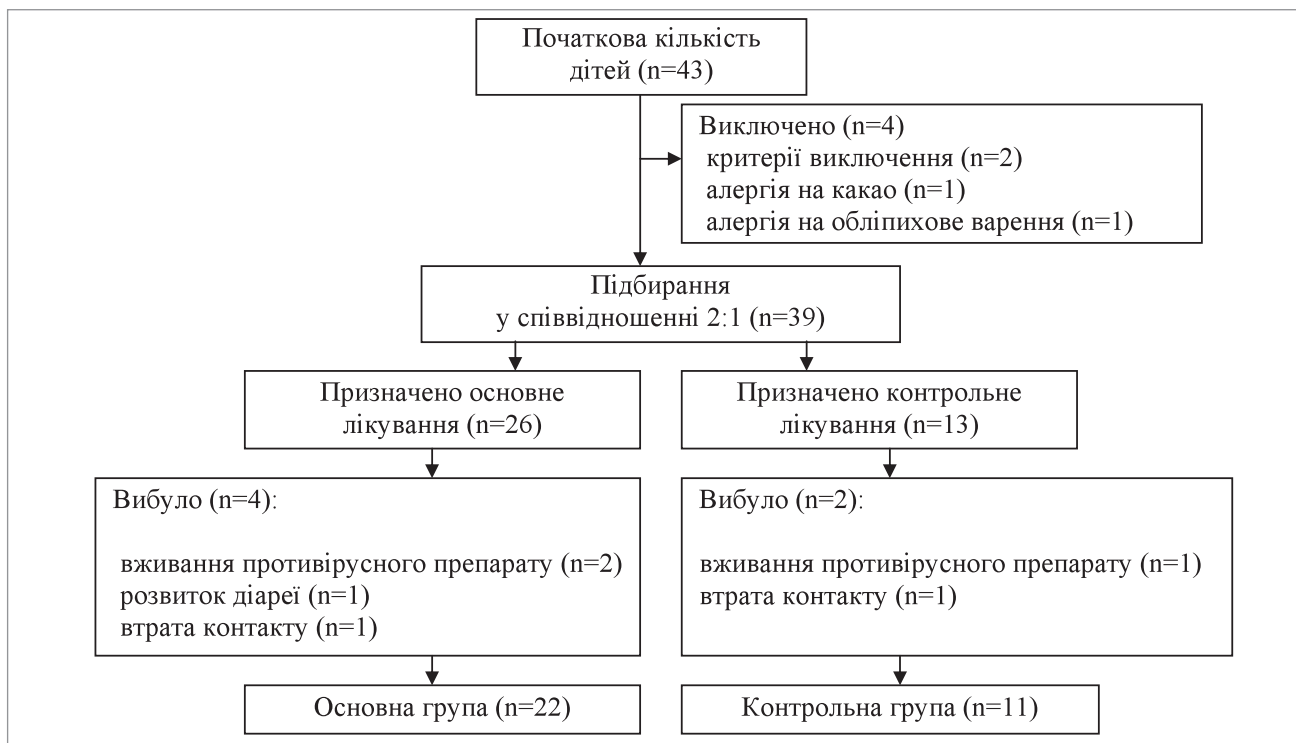
Рис. 1. Хід відбору пацієнтів